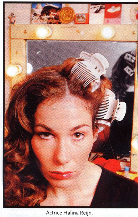
Actrice Halina Reijn.