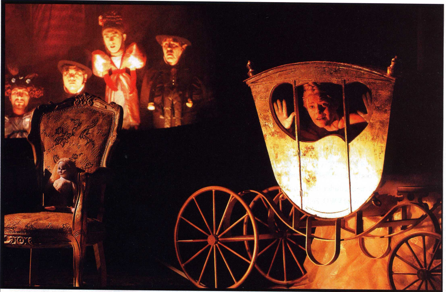
Opera La Cenerentola van het gezelschap Opera-Zuid.

'theaterfotograaf' durfde noemen. Een jaar geleden zei ik: verdomd, ik ben gewoon theaterfotograaf. Het begon met dans, daarna kwam de opera, daarna toneel. Het is een mooie gang, van de esthetische dans naar de spanning en emotie op het grote toneel. En dan volg ik nu ook musicals. Ik bestrijk nu vrijwel alle gebieden van het theater.'