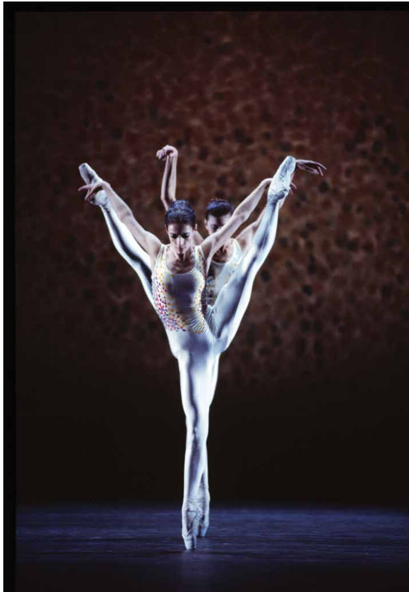
VOLUNTARIES (1994), Het Nationale Ballet